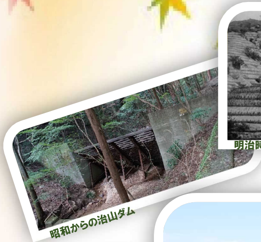
昭和からの治山ダム