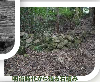
明治時代から残る石積み