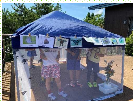
写真：展望デッキでみつやり体験